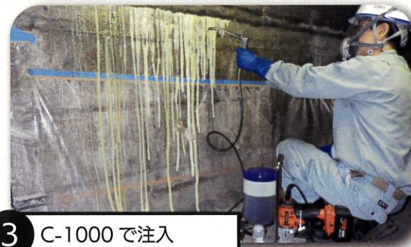
3 C-1000 で注入