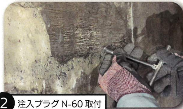
2 注入プラグ N-60 取付